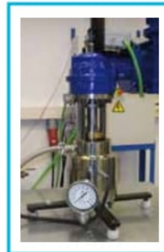
Equipo de ensayo para emisiones fugitivas