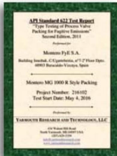
API 622 2nd Edition, 2011