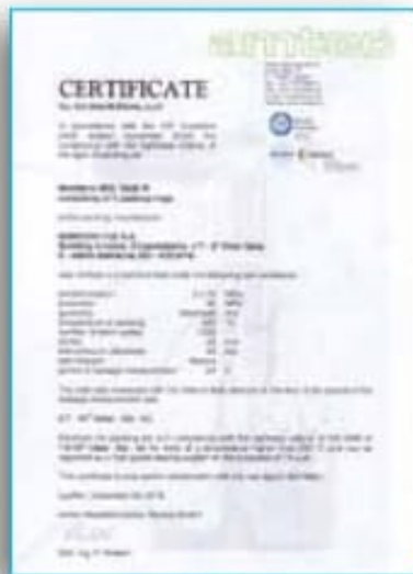
TA-LUFT VDI 2440